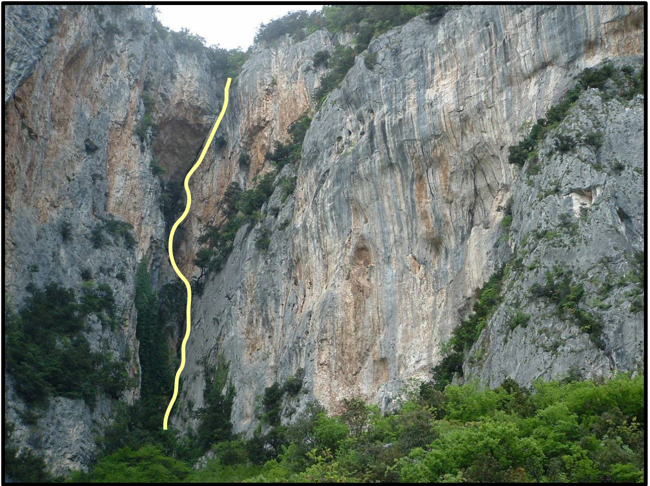
“Le Parisienne” - tracciato